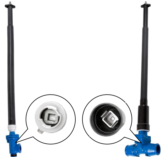
DN 15 - DN 32