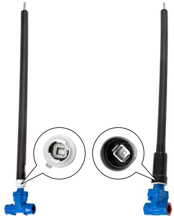
DN 15 – DN 32